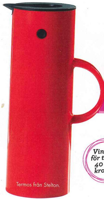
Termos från Stelton.